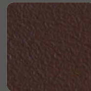
Braun / Brown 20129