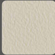
Creme / Cream 20130