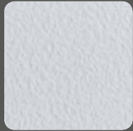
Ferrari-Weiß / Ferrari-White 10120