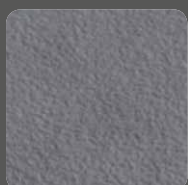
Dunkelgrau / Dark Grey 07432