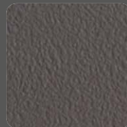
Matt-Braun / Matt-Brown 5015