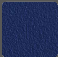
Dunkelblau / Dark Blue 10295