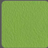
Grün / Green 07485