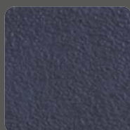
Anthrazit / Anthracite 07445