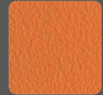
Apfelsine / Orange 20127