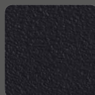
Matt-Schwarz / Matt-Black 00002