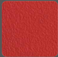
Ferrari-Rot / Ferrari-Red 07478